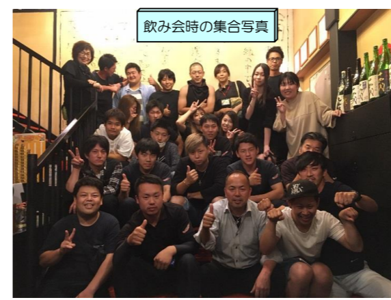
飲み会時の集合写真