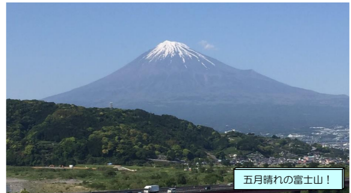
五月晴れの富士山！