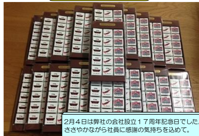
2月4日は弊社の会社設立17周年記念日でした。 ささやかながら社員に感謝の気持ちを込めて。