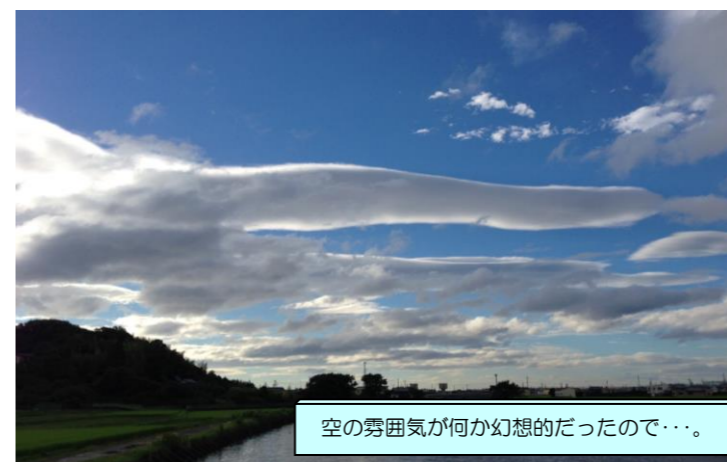
空の雰囲気何か幻想的だったので・・・