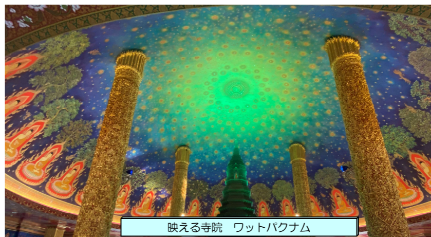
映える寺院 ワットパクナム