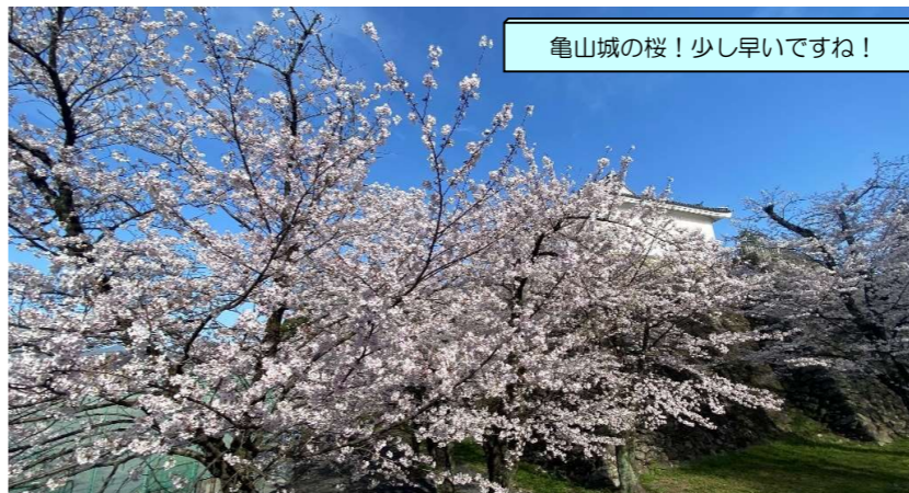
亀山城の桜！少し早いですね！