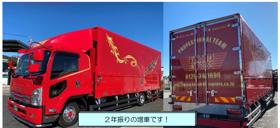
2年振りの増車です！