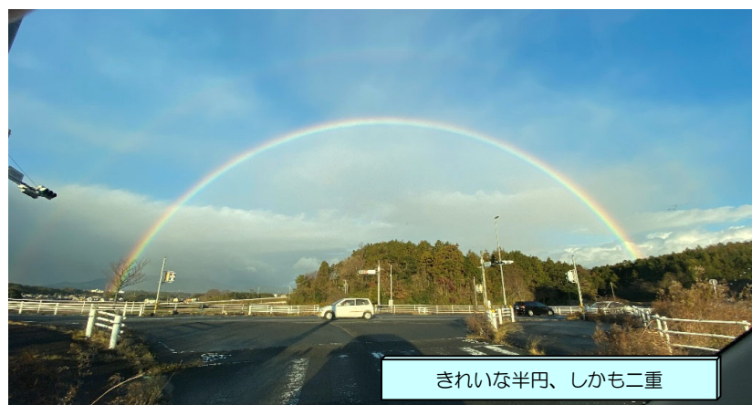
きれいな半円、しかも二重