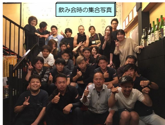
飲み会時の集合写真