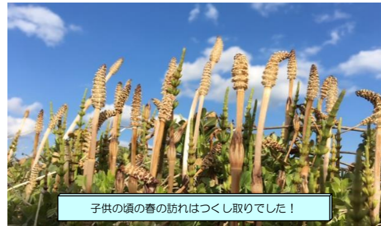
子供の頃の春の訪れはつくし取りでした！