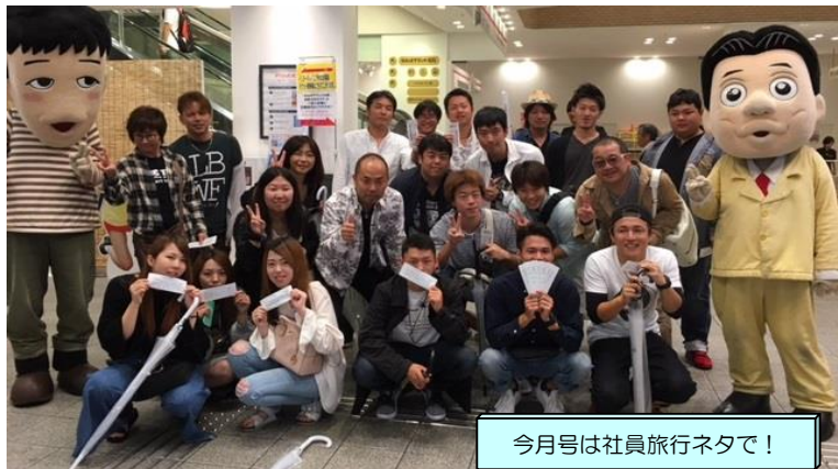
今月号は社員旅行ネタで！