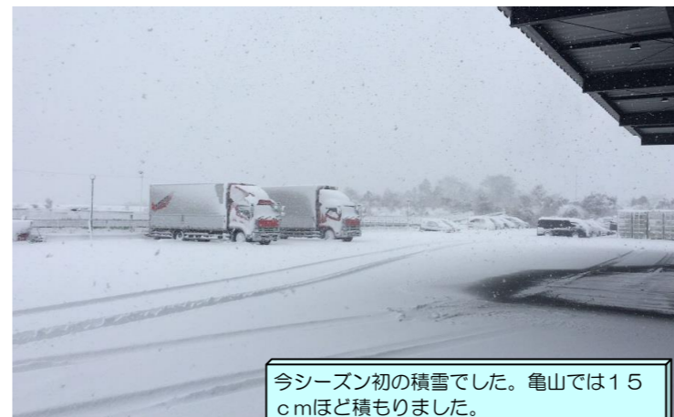
今シーズン初の積雪でした。亀山では15cmほど積もりました。