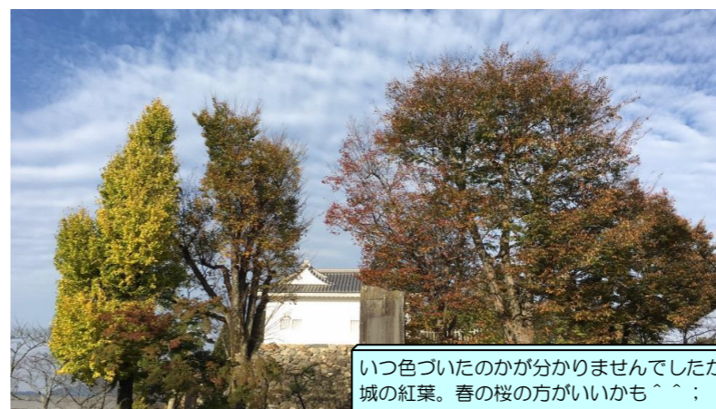
いつ色づいたのかが分かりませんが亀山城の紅葉。春の桜の方がいいかも^^;