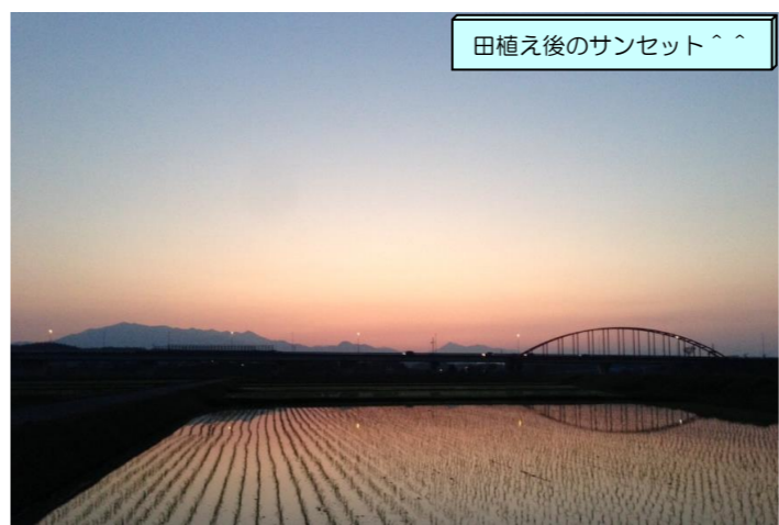
田植え後のサンセット^^