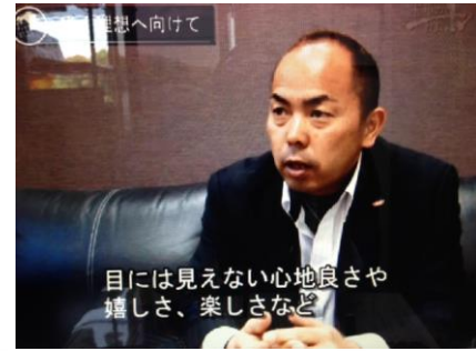
目には見えない心地良さや嬉しさ、楽しさなど。

さすがプロですね！。一時間半くらいのインタビューを約八分の映像でまとめていただきました。