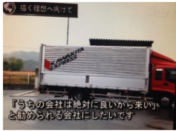
『うちの会社は絶対に良いから来い』と勧める会社になりたいです。

ターゲットとしては採用がメインですので、その視点での構成になっていきますが、過去↓現在↓未来という流れでストーリーができています。