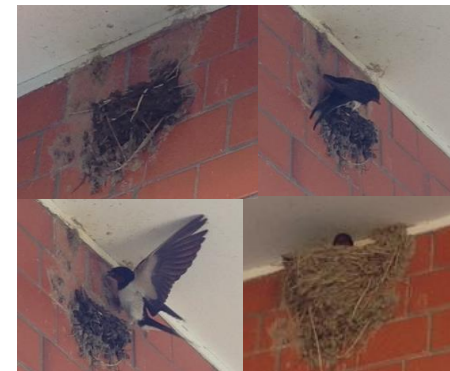
今年も我が家にツバメが帰ってきました！