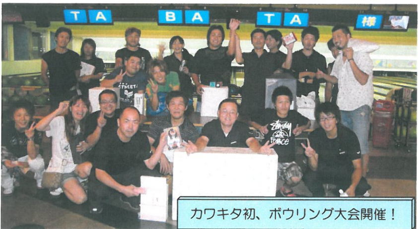
カワキタ初、ボウリング大会開催!